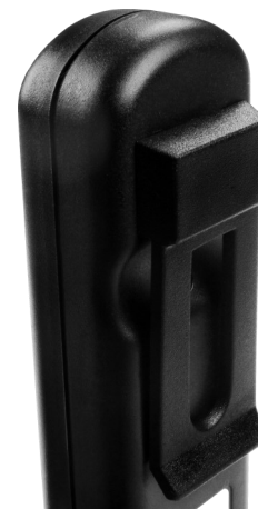
wersja z zaczepem do paska PUK-303/Z