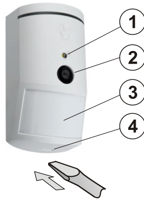
Afbeelding: 1 – flits voor verlichting 2 – cameralens; 3 – lens van de PIR-detector; 4 – deksellijpe;

De detector kan ook geïnstalleerd worden aan de muur of in de hoek van een kamer. Er mogen in het zichtveld van de detector geen huisdieren zijn, noch objecten, die snel van temperatuur wisselen (bv. verwarmingsvoorzieningen) of bewegen (bv. gordijnen boven een radiator of gerobotiseerde stofzuigers). Het wordt niet geadviseerd om de detector tegenover vensters of op plekken te installeren met een intensieve luchtcirculatie (dicht bij ventilatoren, hittebronnen, airconditioningsopeningen, niet-afgedichte deuren, enz.). Er mogen zich voor de detector geen obstakels bevinden, die het zicht ervan over het beschermde gebied kunnen belemmeren.