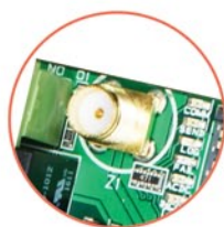
Złącze antenowe SMA