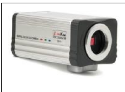
Kamera kolorowa C 3111 / CKB-S112D D/N